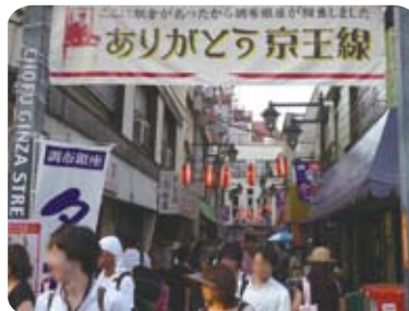
▲地下化のムードを盛り上げる商店街の横断幕