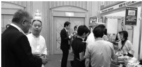
多くの商談が繰り広げられた「多摩の物産&輸入品商談会12」

三鷹商工会、小金井市商工会、武蔵野商工会議所が 「第2回武蔵野エリア産業フェスタ」 11月8、9の両日に