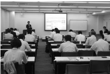
専門家から事例も紹介された製造業対象セミナー

東京商工会議所の主催、当連合会の協力で「製造業対象セミナー」が開かれる 「経営力向上フォローアップ事業」などをPR