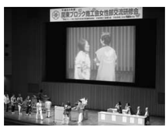
華やいだ雰囲気にもまれた関東ブロック商工会女性部交流研修会

関東ブロック商工会女性部連合会、茨城県商工会女性部連合会による「平成二十四年度関東ブロック商工会女性部交流研修会」が七月十一、十二の両日、つくば市内のつくば国際会議場、ホテル