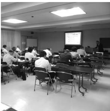
繰り返し訓練を行うことの重要性が指摘されたBCP対策セミナー