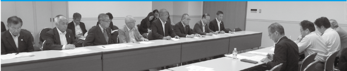
「3万100会員が希望している」と訴えた民主党東京都総支部連合会への要望