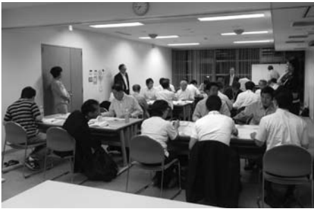
参加者同士が打解けた管理者育成塾

「リーダーとしての最小限の素養」、「営業力を高めるために」、「組織の力を引き上げるポイント」、「経営全体をみわたせる」を自分のものとしていただくことを狙いに三人の専門家（中小企業診断士）が指導に当りました。初日の七月三日は「リーダーとしての最小限の素養」を狙いに開催。