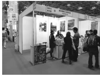
瀬堀養蜂園の蜂蜜[Pure Island Honey]を紹介する小笠原村商工会コーナー