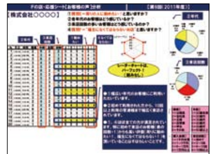
▲応援シート分析結果