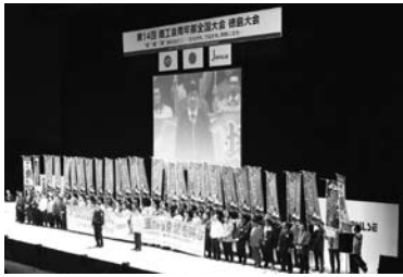
多彩な事業を繰り広げた青年部全国大会

とくしまで開かれ、全国からおよそ二千五百人が結集、主張発表大会、文化交流フォーラム、交流会