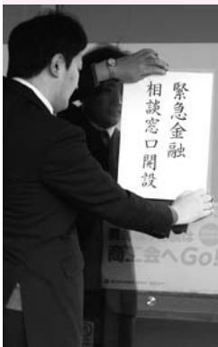
緊急金融相談で連合会玄関に案内を張り出す