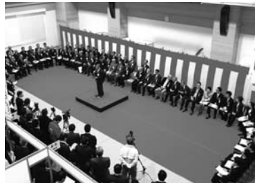
「第12回たま工業交流展」のオープニングセレモニー

「」を開設、問い合わせに答えました。とくに、今年度は「中小企業金融円滑化法」が三月末で期限切れを迎え、さらに、二十九、三十の両日は土曜で金融機関も休みであったことから例年にまして問い合わせが多いのでは...と緊張して臨みました。