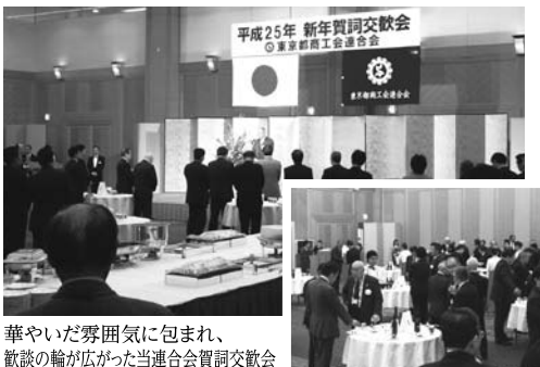
華やいた雰囲気にもまれ、 歓談の輪が広がった当連合会賀詞交歓会

連合会は6年ぶりに開催しました。青年部は1部で先進的活動事例を勉強、女性部は設立30周年記念式典を併せて開きました。同友会も1部で“笑顔の効用”を学びました。