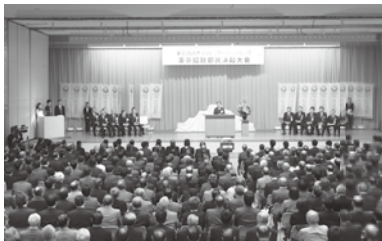
大会議場が「人」、「人」で埋まった決起大会(中央は挨拶をする猪瀬知事)

「2020オリンピック・パラリンピック東京の招致都民決起大会」が開かれる 招致に140万人を超える人が署名 猪瀬都知事を引き渡し