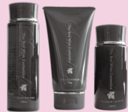
▲自社ブランド 「ソムリエージュ」シリーズ (左からローション、パップ、 ミルキージェンズ)