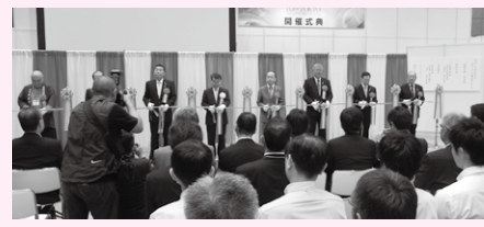
▲「江戸・TOKYO 技とテクノの融合展2014」のオープニング

「中小企業の方々にビジネスチャンス の場、ビジネスパートナーとの出会いの場をと東京信用保証協会主催の「江戸・TOKYO 技とテクノの融合展2014」が十月二日、東京・丸の内東京国際フォーラムで開かれました。当連合会も支援機関エリアに他の十二支援機関とともに出展、来場者に「経営革新計画」などをPRしました。 出展規模は過去最高となる二百八十七企業・支援機関となりました。日々の経営に役立てていただこうという著名講師による三つの講演会も開かれました。