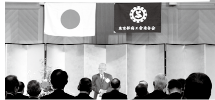
東京都商工会連合会の 賀詞交歓会▶

来賓挨拶では、関東経済産業局長、東京都産業労働局長が祝辞を述べ、続いて自由民主党、公明党、民主党の国会議員、都議会議員、多摩地域の市長らが登壇し、代表者がお祝いの言葉を述べました。