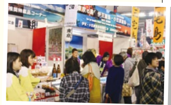
▲にぎわう伊豆・小笠原諸島のブース

また、今回も府中観光協会、大多摩観光連盟と連携し、各島の焼酎、リキュールなど地元の自慢の酒を用意し、島ならではの味をその場で楽しんでいただきました。