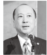
◀山本東京都産業労働局長