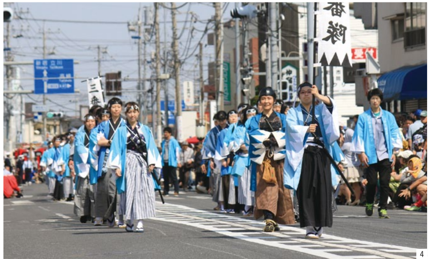
1. 50種類500本の梅が咲き競う／京王百草園 2. 重要文化財の不動明王像／高幡不動尊 3. オランウータンのスカイウォーク／多摩動物公園 4. 5月に開催される「ひの新選組まつり」