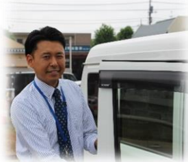
あきる野商工会 経営指導員（主事） 平成20年入職

あきる野商工会はチームワークが素晴らしく、互いを助け合い、日々安心して仕事に取り組むことができます。仕事を立て込んでいる時や困難な案件に携わっている時は、先輩や上司などが声をかけてくださり、改善方法を教えていただき、孤立することなく、前向きに仕事を行うことができます。