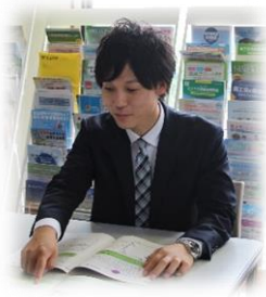
東大和市商工会 記帳相談員（一般職） 平成28年入職

出身地の商店がどんどん閉店していくのを知り、街が元気になるような仕事をしたと探していく中で商工会にたどり着きました。事務職だと思っていましたが実際に働いてみると事業所の支援や、地域振興に関わる事業で外に出ることが多く、いろいろな人に出会い、とても充実した毎日を過ごすことができます。