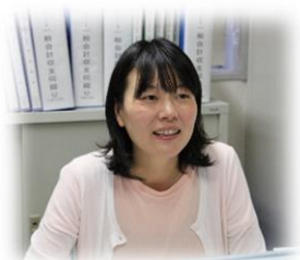
あきる野商工会 業務支援員（一般職） 平成27年入職

地域に知り合いが増え、いろいろな所で声をかけてもらえること心強く感じます。また、産前・産後休暇と育児休業を取得し、時短勤務で復帰しました。一緒に働く職員の方や会員さんが理解、応援してくれているので、仕事も子育ても頑張ろうと思えることです。