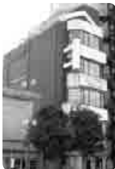
ヒューマンライフが入る 福生駅前のビル

経営革新計画のアイデア、考えはこの中で浮かんだ。試験の中身を見ていると過去問を繰り返しやって穴を塞いでいくようなものなのでそれをネット上でできるように、簡単なものができたら全国での国家試験を目指している方々にかなり役に立つので