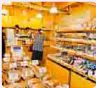
▲目移りするほどに店内には「小金井」が並び