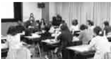
熱心に講義に耳を傾ける受講者

を取りながら熱心に耳を傾け、また、疑問や関心事には何人もの人が質問をする光景が見られ、創業への強い意欲を感じさせていました。