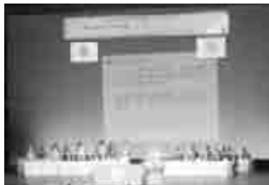
多彩な行事を繰り広げた女性部全国大会

く」をスローガンに十月十三、十四の両日、富山市で開かれました。全国から商工会女性部のリーダー