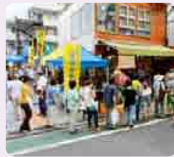
▲イベントの開催で「黄金や」の前には長い行列が