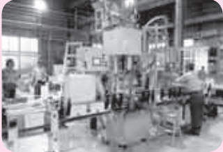
導入を計画している最新の醤油充填ライン

麹菌の酵素が大豆の蛋白質を分解、旨味をつくる。また、アミラーゼという酵素が小麦のでんぷんを糖に変える。良い麹をつくとこれらの分解をより強く進めることができ、良い醤油をつくれる。 温度を管理しながら麹をつくるわけだが、新しい工場ではそれをシステムで行いようとする。今は全くの手動