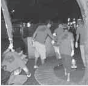
駅ロータリーなどを清掃

全国の一七七九十五の商工会青年部が八月二十六日午後六時から一時間、一斉に街に出て清掃活動を展開しました。これは商工会法が施行五十周年を迎えたことから全国商工会青年部連合会が五十周年を記念「日本全国で、地域に感謝を伝えよう!!」と「クリーンアップ全国大会」の名前で全国統一事業として全国の商工会青年部で実施したものです。