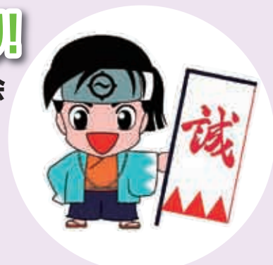
▲新選組シンボルキャラクター 幕末チャレンジャー「選之介」