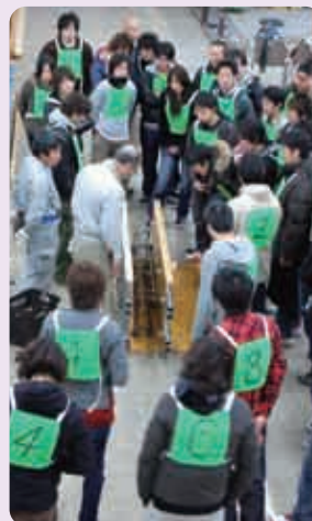
▲学生が目を見せた明星大学建築学科の建築施工実習(型枠)

シナジースキーム事業の一環として、障害者就業支援セミナーを開催し、その運営にあたり市内特別支援学校や社会福祉協議会、障害者生活・就労支援センター等の各種福祉団体との連携が深まり、「日野市障害者就業支援連絡協議会」を設立しました。今後も障害者支援事業の継続・拡大を図ります。