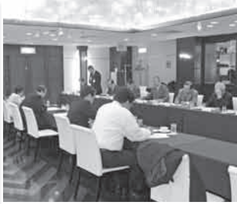
要望を詳しく伝えた自由民主党との意見交換会