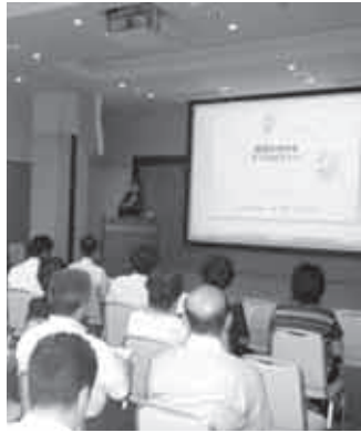
メモする人がたくさんいた西武線エリアの「共催講習会」

多摩地域四カ所での「共催講習会」 ー。これは多摩地域の商工会が地域ごとに協力、まとまって商工会会員の皆様らを中心に小規模事業者の方々の経営改善や経営力アップに役立てていただくという事業。参加