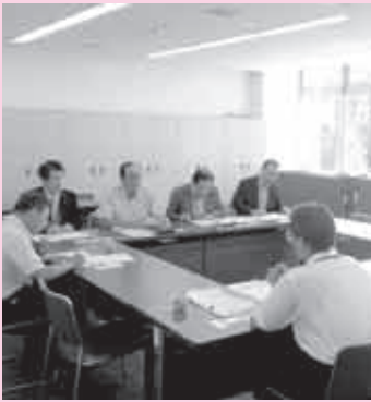
9月10日に開いた東京都都市整備局との会議