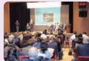
▲多くの分野から出席があった「障害者就業支援セミナー」