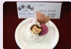
▲地元ブルーベリーを使ったコンテスト 最優秀賞の「ライオンくん・ベリーサンデー」 (多摩動物公園事業課)