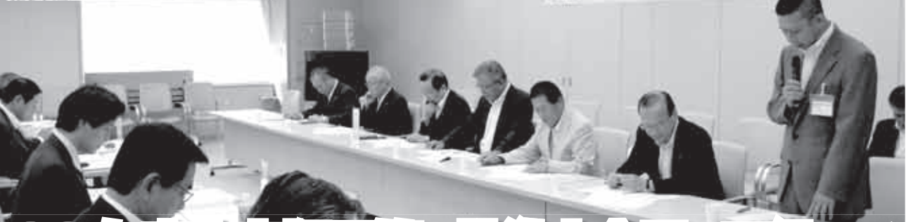
取組会 自民党各種団体予算要望聴取会