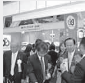
主催者、来賓(右から2人目は桂会長)も展示を見学

東京信用保証協会は当連合会の後援などにより九月十四日、東京丸の内東京国際フォーラムでつたえる・つながる・つくりだす「中小企業が未来をひらく」をテーマに「江戸・TOKYO 技とテクノの融合展2010」を開きました。当連合会も出展、全体では昨年より六多い百八十六の中小企業・支援機関がブースを構えて自慢の製品、技術、サービス、施策などを展示、PRをしました。八千五百五十二人が入場をしました。