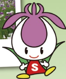
▼菖蒲まつりキャラクター「しょうちゃん」