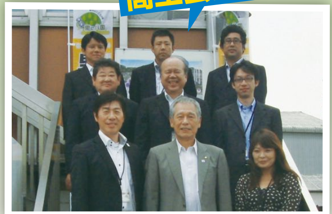
▲新義友会長(前列中央)と職員の方皆さん