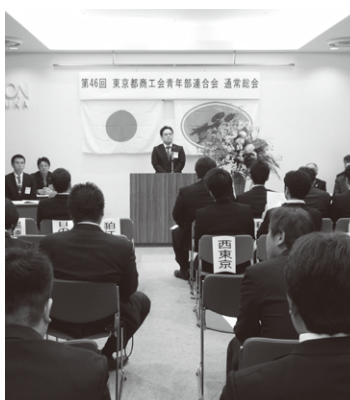
▲都青連の第46回通常総会

同協会ホームページ http://www.jai.org を参照下さい。 ▼問い合わせ 同協会 ☎03・3464・6991へ。