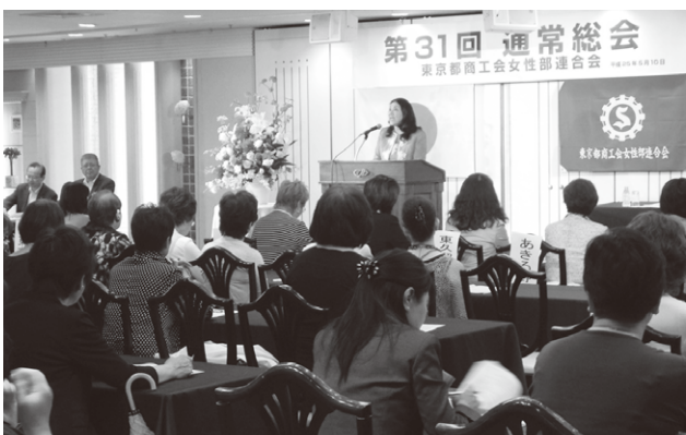
▲都女連 第31回通常総会

業に恩恵が及ぶには時間が掛かること、女性の力を生かすプランが経済再生計画の柱になっていること、景気が良くなると創業が増えることなどについて述べ、その上で「街に早く創業者が溶け込んで力を発揮してもらえよう受け皿を用意していただきたい」と呼び掛けました。 総会後には懇親会を開き、一時間半に亘って親睦を深めました。