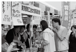
▲にぎわう女性部連合会のブース

当連合会ブースでは、伊豆・小笠原諸島の特産品を販売、大島町直送のアイスクリームなどが大好評でした。女性部連合会は国分寺市、あきる野市、三鷹市、日野市、瑞穂町の5つの商工会女性部が地域一押しの特産品を販売、終日にぎわいをみせていました。B級グルメを販売する20のブースでは順番待ちの列が途切れず、完売が続出していました。