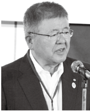
▲2期目への抱負を述べる村越会長

とは評価できる。一方、これによって商工会の責任も大きくなった。商工会のあるべき姿を示していかなければならない。そこで、昨年、商工会等あり方検討会を設置して、行くべき道を示した。だが、依然として会員数が減少傾向にあるなど課題は山積している。社会構造の変化もあるが、ここで頑張らないと商工会の存在意義を問われない