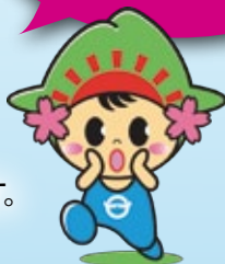
▲日の出町 イメージキャラクター 「ひのでちゃん」

日の出町 商工会 Hinodemachi Shokokai http://www.042-597-0270.com/