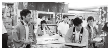
▶多摩の逸品をアピール

9回目を迎える同見本市には、90を超す企業や団体・学校が出展しました。商工会地域からも25事業者が出展し、多摩の逸品のPRに力を入れていました。また、夏季観光シーズンを迎える伊豆諸島・小笠原諸島の紹介も行われました。今回も東北地方から多数の参加があり、東京ではなかなか手に入らない食の逸品に人気が集まっていました。