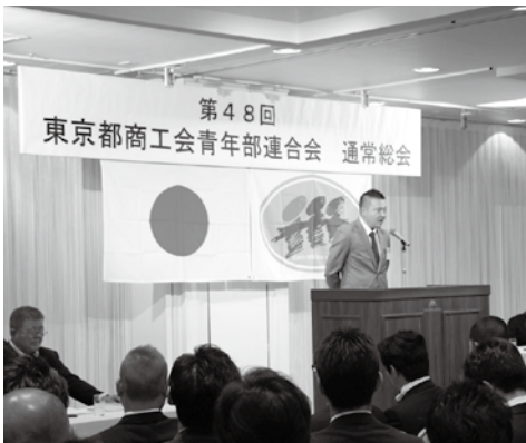
▲都青連の第48回通常総会