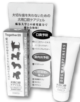
犬用口腔ケアジェル「ドッグハピネス」

歯周病はヒトの健康寿命に大きな影響を与える疾病です。また、今や家族の一員となっているペットでも歯周病が問題化していて、平均寿命が14歳以上と長寿命化している犬でも、3歳以上の80%が歯周病予備軍といわれています(アニコム損害保険会社調べ)。 ソーシンは、犬の歯周病予防・口腔ケア分野が将来的に成長分野であるとして、同分野に進出することを決め、昨年6月に動物用医薬部外品製造所の認可を得ました。 同社は、化粧品、歯みがき、健康食品などの企画・開発・製造を行っており、これまで、ヒト用に植物由来の成分を加えることで歯周病に効果を発揮する口腔歯みがきを開発・製造してきました。 犬用口腔ケアジェルの開発は、犬特有の歯周病菌P・グラエに対する抗菌