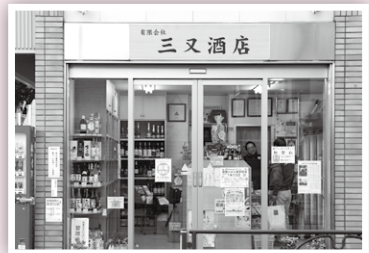
三又酒店は「地域の情報ステーション」▶

他の会員さんから「商工会は何をしてくれるの？」という声を聞くことがある。そうした疑問は、小さなことでも積極的に商工会に相談することで解決できると思う。支援メニューの活用も可能だ。私自身、会員さんがもっと身近に商工会を感じられるように、有益な情報を地域の会員さんに、あるいは商店街に伝えていかなければならないと考えている。情報を共有し商工会との関係をこれまで以上に密にしていこうとすることが大事だと思う。