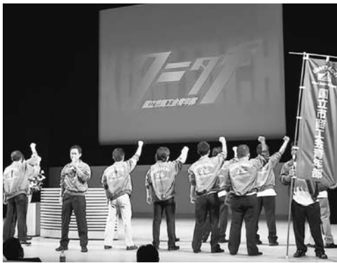
大谷さんの主張を前に国立市商工会青年部が応援