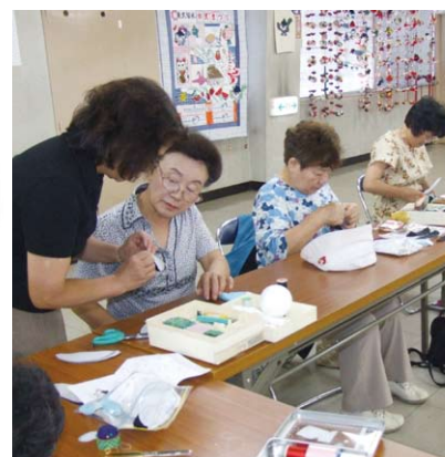
▲東久留米市商工会女性部が取り組んだ、まちおこしキャラクター「オナガのひいちゃん」の懸念な人形づくり