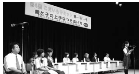
携帯への対応が話し合われた「こだいらサミット」

親御さんは子供の携帯に「持たせる」、「持たせない」などのように対応をしようとしているのでしょうか。小平商工会は九月六日、小平市内のルネこだいら中ホールで「親と子の上手なつきあい方PartⅢ」とし、「あなたはケイタイで悩んでいませんか?」をテーマに「第四回こだいらサミット」を開きました。サミットには小学生、中学生、その保護者の方二百十八