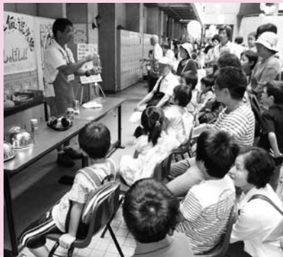
大人も真剣な眼差しで実験を見守った 「科学の祭典」

科学の不思議に触れ、子供らが目を輝かせる姿は将来に明るさを感じさせて大変、良いものです。今年も小金井市商工会が共催をする、国際ソロプチミスト東京―小金井など主催の「2008青少年のための科学の祭典 東京大会in小金井」が敬老の日の九月十五日、東京学芸大学小金井キャンパスで開