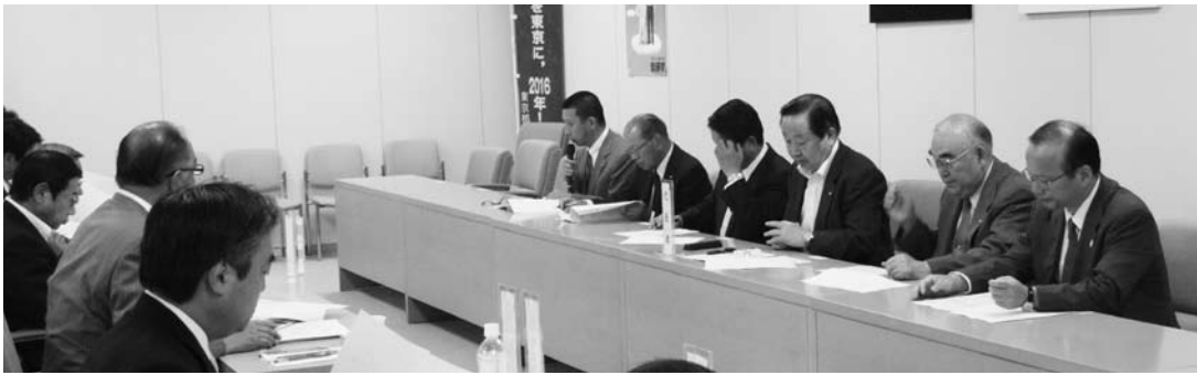
切実な要望を強く訴え、実現を求める（東京都議会自由民主党で）