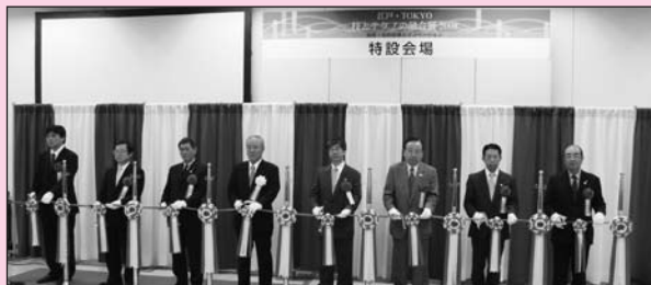
横山理事長らとともに 桂会長がテープカット

また、同展では同時開催として広域的な取引のきっかけづくりを目指した「八都県市合同商談会」、技術力のある中小企業と企画力のあるデザイナーとの出会いをつくる「東京デザイナーマーケット」、それと「ジエトロ海外企業出展ゾーン」も開かれます。