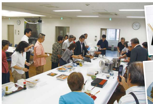
▲参加者皆が興味津々と臨んだ小金井市商工会の「江戸料理」の試食検討会