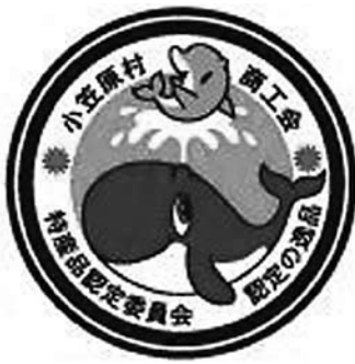
クジラ・イルカをデザインした小笠原村商工会の「認定シール」

を交付し、商品には小笠原のトレードマークともいえるクジラ・イルカをデザインした「認定シール」の貼付をします。同商工会では、報道関係先や問い合わせに対して積極的に紹介するとともに、物産展等で優先して販売することとしています。