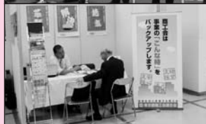
経営相談に応じた 当連合会のブース