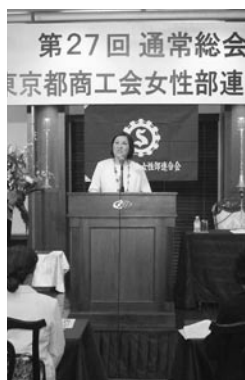
退任役員に花束贈呈などがあつた第27回通常総会