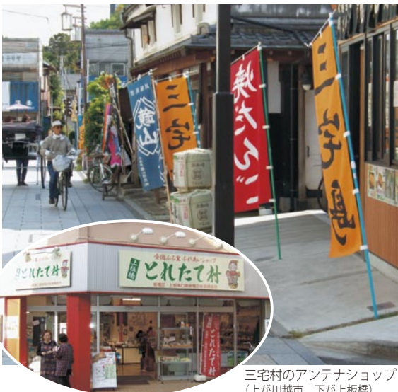
三宅村のアンテナショップ (上が川越市、下が上板橋)