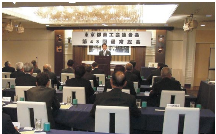
東京都の幹部、金融機関のトップら大勢の来賓を招いて開いた当連合会第48回通常総会