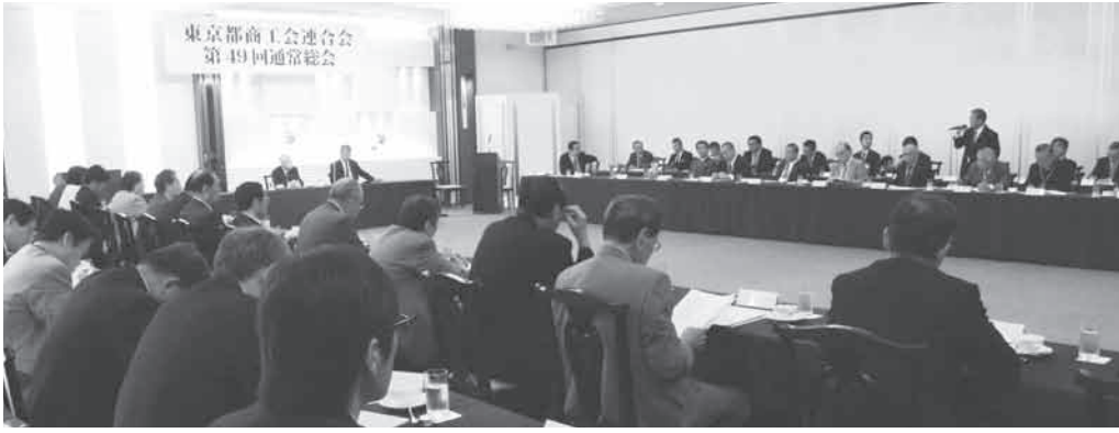
各商工会が会員増大に向け強い意欲を示した情報交換会