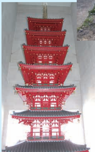
▲国分寺市商工会のシンボル 七重の塔の模型