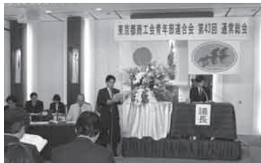
都青連の第43回通常総会

た。秀単会表彰 を行いまし 表彰され た。を述べまし 最後に総 会では青年 部員増強優 秀単会表彰 を行いました