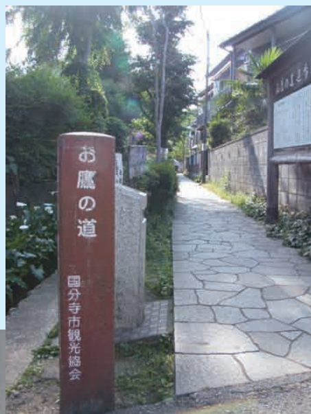
▲「お鷹の道」奥に「真姿の池湧水群」がある

また、国分寺市はブルーベリーの栽培が非常に盛んで観光農園も多く存在しております。商工会女性部ではこれを材料に爽やかな甘酸っぱさが売りのブルーベリードレッシング「こくぶんじベリー」を手づくりし、販売しております。市内外のイベントに数多く出展し、現在までに約5千本を販売してきました。新たな地域ブランドの確立を目指して活動しておりますので応援をよろしくお願い致します。