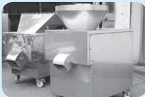
食品リサイクル関連機器破砕機 =固液分離型【右】と減容型【左】

創業以来、三十八年になる。板金で大手重工の下請けとしてスタートを切った。この間、板金の対象は大型トラック、トラクターなどの重工業品から高い精度が要求される半導体装置となり、精密板金へと変わった。