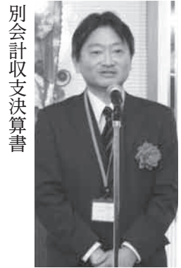
来賓挨拶をする山手斉・東京都産業労働局商工部長