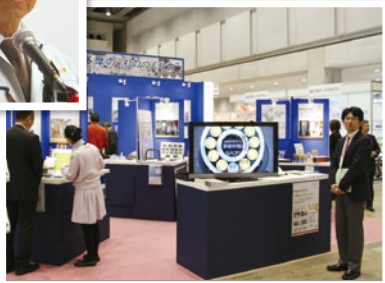
▶19社が出展した都商工連のブース