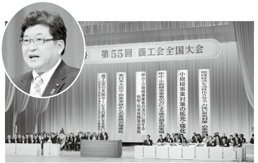
▲秋生田内閣官房副長官から安倍総理の祝辞をいただく