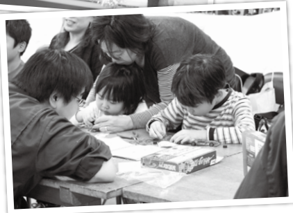
▶ソーラーカーの組立ては大人気

連）、東京都立多摩職業能力開発センター、東京都農林水産振興財団が協力して開催しました。