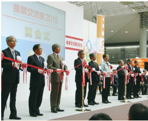
▲産業交流展 2015の開会式