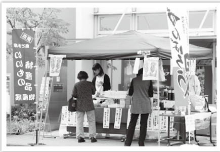
▲都商工連は多摩・島しょの物産を販売

同スクエアに拠点を置く、東京都立産業技術研究センター多摩テクノプラザ、東京都中小企業振興公社多摩支社、東京都商工会連合会（都商工