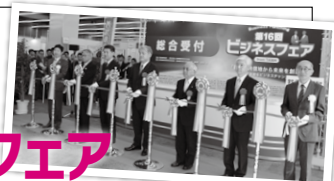
▲開会式でのテープカット

西武信用金庫、首都圏産業活性化協会（TAMA協会）が主催し、東京都商工会連合会（都商工連）、多摩地域の商工会などが後援する「第16回ビジネスフェア from TAMA」が11月6日、東京・水道橋の東京ドームシティプリズムホールで開かれました。広域ネットワークを使い、多業種・多企業とのマッチング、産学官連携での課題解決やイノベーションの創出などの実現を目指すためのフェアで、227の企業・機関が出展しました。今回のテーマは「新たな発信地から未来を創造～この変革期をビジネスチャンスに～」です。「ビジネスコラボレートコーナー」や「知財等活用マッチングコーナー」など、大手企業とのマッチングの場を設けました。