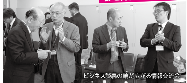
ビジネス談義の輪が広がる情報交流会

開かれました。商談会&情報交流会は、中小製造業同士で新たなビジネスパートナー企業を発掘してビジネスチャンスを生み出せるよう「出会いの場」を提供するものです。