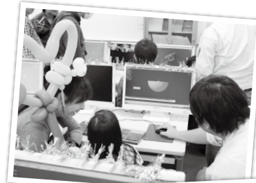
▲CADの体験コーナー。分かるかな？