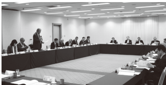
▶活発な議論が交わされた島嶼地域資源PR事業報告会議

都商工連は3月2日、港区のホテルで「平成28年度島嶼地域資源PR事業報告会議」を開きました。会議では、都商工連から28年度の島嶼地域資源PR事業の実績報告と29年度の事業計画の説明があり、島嶼地