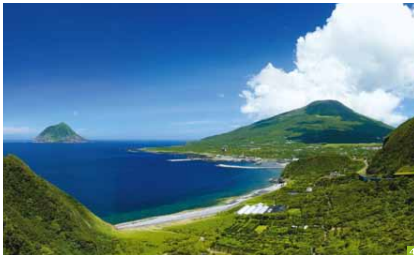
1. 黒潮洩八丈の海は1年中ダイビングが可能。アオウミガメと遭遇も期待できます。2. 八丈太鼓は上拍子と下拍子に分かれ両面を2人で叩きます。下拍子がリズムを刻み、上拍子はアドリブで。女性の着物は日本三大紬の黄八丈です。3. フリージアの見ごろは3月下旬から4月初旬。赤、黄、白、紫と色とりどり。今春51回目のフリージアまつりが開かれました。4. 大坂トンネル付近からの八丈富士(右)と八丈小島(左)の眺望。おだやかな山容の八丈富士は高さが854m。伊豆諸島の最高峰です。