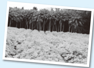
青々と育ったアシタバ▶

〒100-1401 東京都八丈町三根5068-2 TEL:04996-2-0596