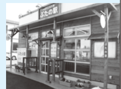
本社横の「ぶたの駅」▶