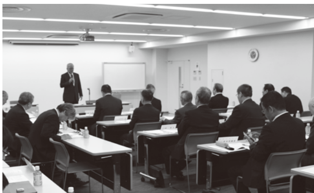
▲重点項目に「2025年多摩島嶼商工会等ビジョンの着実な実行」などを盛り込む

多摩島嶼地域の経済を支える小規模事業者が経営を大胆に見直し、世代交代や業態の転換、経営基盤の確立などを図りながら、地域で持続的