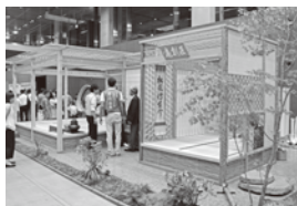
▲会場に忽然と本格的な茶室が...