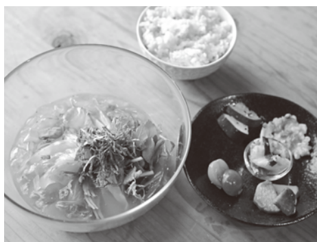
▲つちのこ食堂のランチ

また、ランチタイムの時間帯に元保育士さんなどが、親子向けのわらわらたや絵本の読み聞かせ、手遊び、お絵