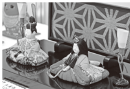
▲曲線がやさしい江戸木目込人形