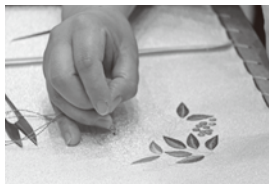
▲匠の繊細な技が優雅な模様を描く日本刺繍