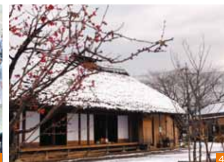
1. 狛江古代カップ多摩川いかだレース: 夏の多摩川の名物行事です。スピード部門と、工夫を凝らした手づくりいかだが楽しめるアイデア部門があり、白熱のレースが楽しめます。近年はオリンピックの参加やピアガーデンの開設などにより多くの見物客で賑わいます。 2. こまえ桜まつり: 市制施行45周年を祝して始まったイベントです。開催日までの一週間はライトアップされた幻想的な夜桜が楽しめます。まつりの当日は桜を眺めながらの飲食や子供向けのイベントが行われます。 3. 市民まつり: 市民が力を合わせ作り上げる狛江市最大のイベントです。パレードやお神輿で盛り上がります。出店やゲーム大会など、市民が楽しめるイベントも開催されます。 4. むいから民家園: 江戸時代の建物である旧荒井家住宅主屋と旧高木家長屋門を移築復元し、2002年に古民家園として開園しました。「むいから」とは屋根葺きに使われている麦わらのことです。季節ごとにさまざまな展示や体験学習などが行われています。