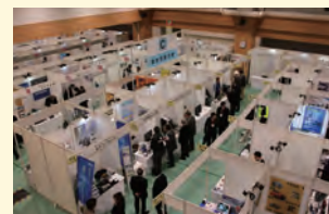
「たま」の元気印企業がこぞって参加