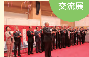
クラッカーを鳴らしてオープン