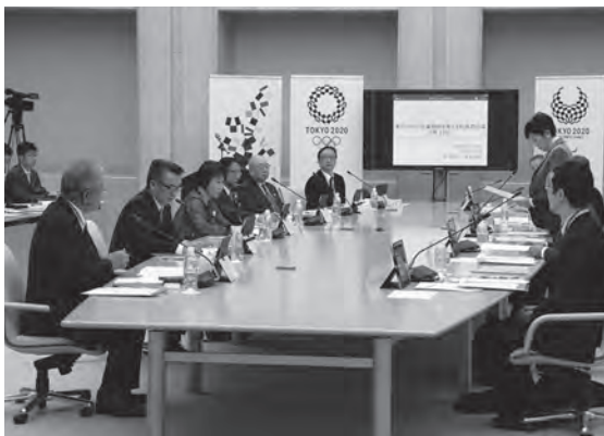
▲有識者会議の様相