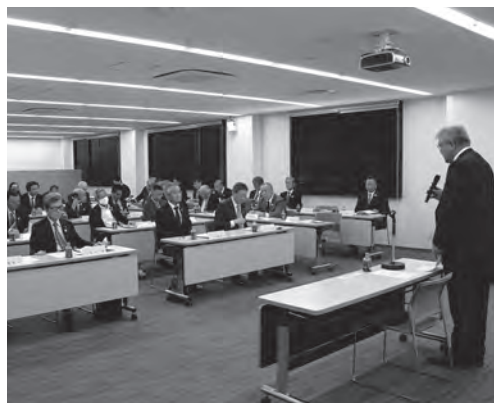
▲臨時総会。9議案を全会一致で承認

商工会、商工会議所、支援機関と130を超える加盟企業による広域的なネットワークで、ものづくり企業の人材確保事業と、従業員の定着率向上、非正規雇用の正規化、賃上げにつながる処遇改善事業に取り組みます。