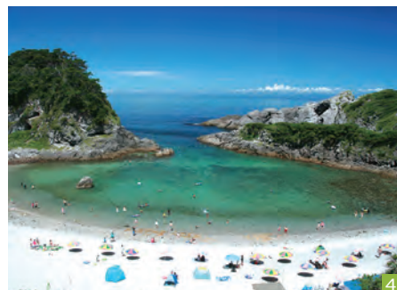
1.モヤイ像と石山展望台：渋谷駅にあるモヤイ像は新島村から寄贈されたもの。新島全島で120体以上設置されている。右上方は式根島。 2.羽伏浦海岸：新東京百景にも選出され、世界的なサーフスポットとしても知られている。6.5kmにも及ぶ真っ白な砂浜が特徴。 3.海中温泉：世界でも珍しい「CO 2 シープ（海底から二酸化炭素が噴き出す）」の温泉。ダイビング時にはウミガメと一緒に泳げる可能性も。 4.泊海水浴場：波静かで透浅な入り江の海水浴場で、家族連れでも安心。磯遊びもできる。