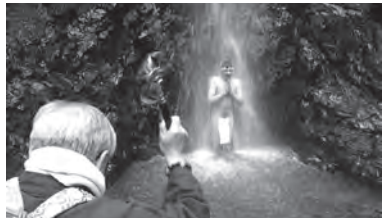
▲ポーランドの青年が滝行に飛び入り