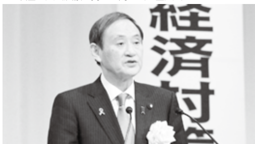
▲「小規模事業者支援に全力を尽くす」と菅官房長官