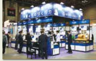
▲多摩のものづくり企業23社の技術・商品を紹介。都商工連のブース「MANUFACTURING TAMA 2018」

15日には、同会場で東京都経営革新優秀賞の表彰式が行われ、メトロール（立川市）が「長距離着座確認エアセンサーの開発」で優秀賞を受賞しました。