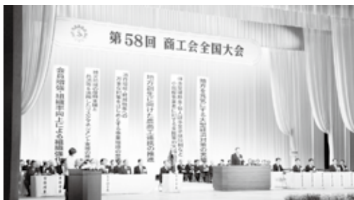
▲6項目の大会決議を掲げた商工会全国大会