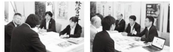
▲経営革新計画の相談もより具体的に ▲事業承継は小規模事業者の大きな課題(多摩・島しょ経営支援拠点の事業継続・経営支援コーナー)