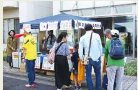
▲都商工連は、島しょの特産品を販売

他の施設では、普段目にするのがない研究機器・設備の紹介などに加え、農産物の販売、園芸教室、多摩産木材を使った木工体験、パークラフトなどの工作教室を開催しました。