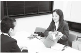
▲女性同士は話も早い?(商談会)

東京都商工会連合会は11月29日、中小企業間のビジネスチャンス創出を支援する「マッチング商談会&ビジネス情報交流会」を