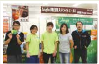
◀トウショ酒販は、「明日葉を使ったクラフトビールで全国区へ」と意気込む