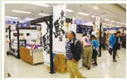
▲島の物産が人気。賑わう都商工連のブース

ご当地食やソウルフードを集めた「おらが自慢のご当地フードコート」には、Hyuga brewery（神津島村）が参加、明日葉入りのクラフトビール「アンジー」が人気を集めていました。毎年激戦となる「ご当地おやつランキング」コーナーには、パティスリーカフェ エム・ヤスヒコ（東久留米市）が出店、ほうじ茶バターロールのおいしさをアピールしていました。