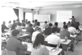
▲三鷹創業塾の講義の様子

会報 11月号P6の多摩むてい島おこしの記事で、事業者の住所に東久留米市とあるのは東村山市の間違いでした。お詫びし、訂正いたします。