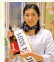
ミス新島も売上アップに役▶