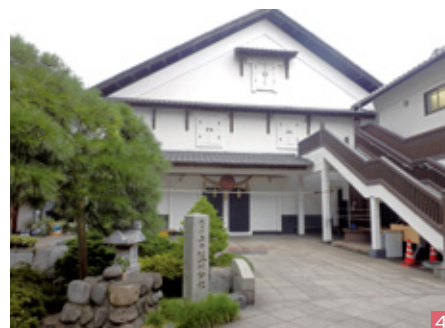
1. 横田ベースサイドストリート:米軍横田基地に面する国道16号沿いの通りにはアメリカンテイストのショップが並び、異国情緒が味わえます。金土日祝日には、観光情報発信地「福生アメリカンハウス」が開館しています。 2. 田村酒造場:1822年創業。敷地内にある、酒造蔵・前蔵・雑蔵・旧水車小屋および脇蔵・上水石垣が、国の有形文化財に登録されています。玉川上水との景観も見事です。 3. ふっさ桜まつり:今年は3月31日(土)から4月8日(日)まで、多摩川沿いの堤防で開催されます。約500本の桜が植えられています。 4. 石川酒造:1863年創業、国の有形文化財に本蔵・新蔵・向蔵など6棟が登録されています。敷地内には、熊川分水が流れ、樹齢400年を超える「夫婦榎」などがあります。