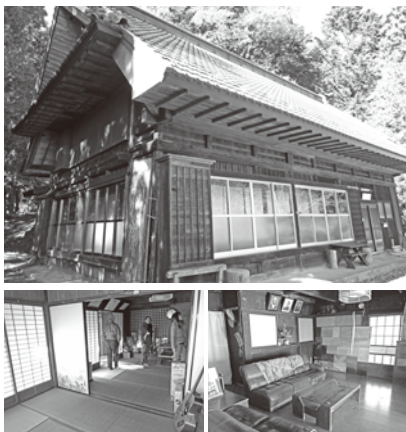
▶不便楽舎とその内部

ロジエクト」です。事業者が決まり、事業可能性調査とモニターツアーを行います。この調査結果を検討し、来年度の事業内容を策定していきます。3月3〜4日に日本人を対象に、10日〜11日には在日外国人を対象としたモニターツアーを実施する予定です。いずれも、松原村の古民家に宿泊します。日本人ツアーでは「不便楽舎」、外国人ツアーは「へんぼり堂」に宿泊します。国の重要文化財の小林家住宅の見学、周辺の温泉入浴、忍者体験、地元の食材を使った料理を味わうなどのプログラムが組まれています。参加者の意見を集計・分析し、課題の整理・改善策を検討し、今後の事業に反映していきます。