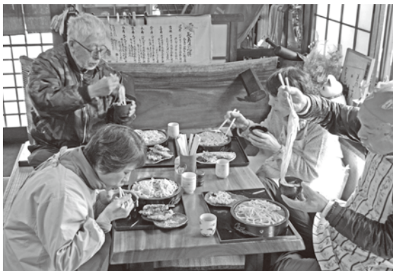
▲みんなで打ったうどんの味は格別