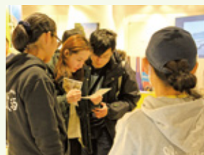
◀島の物産に興味津々

東京駅から徒歩3分というアクセスの良さから、旅行者やショッピング帰りの女性、退社後に立ち寄る会社員なども多く、終日にぎわいを見せていました。