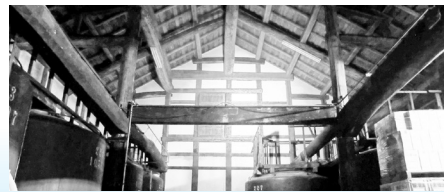
◀小澤酒造の元禄蔵

旅行事業者等を対象としたツアー。貸切りバスで多摩地域の酒蔵を見学、試飲と地域食材を使った料理を体験します。20人程度で秋頃に2回実施し、定期観光化を目指します。