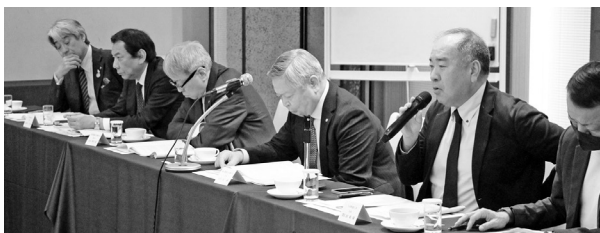
▲間仁田八丈町商工会会長(右)は、座長として会議を進行

の産業の現状は、いかに廃業を回避し現状維持を図るかにある。事業承継者の確保や業種転換、さらには新規創業することで、島の活性化につなげていく。