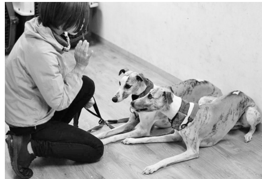
◀トレーニングルームでの訓練の様子

日々の業務に忙殺されがちなか中、商工会は重要な経営のアドバイザーであり、小さな困りごとから毎年の確定申告までフルサポートで助けていただいています。新たな取り組みを始める際には、補助金の獲得でも支援を受けました。商工会は欠かせないパートナーであり、事業を続ける上で不可欠な存在です。