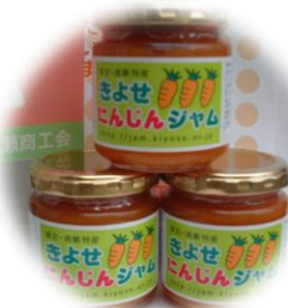
清瀬商工会 『きよせにんじんジャム』