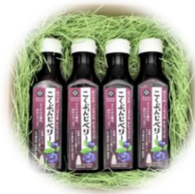
国分寺市商工会 『こくぶんじベリー』