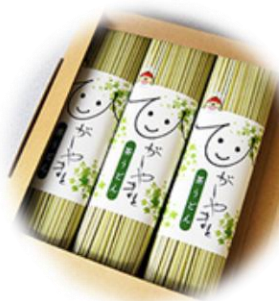
東大和市商工会 『ひがしやまと茶うどん』

地域の特産品を開発して、イベント等で周知や販売を行い、地域を盛り上げるお手伝いをしています。